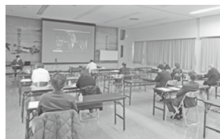
オンラインを通じて開催

最後に、「今年の春闘はコロナ禍でも業績の良い企業と悪い企業の差がはつきりとなるだろう」と話し、講演会を締めくくった。