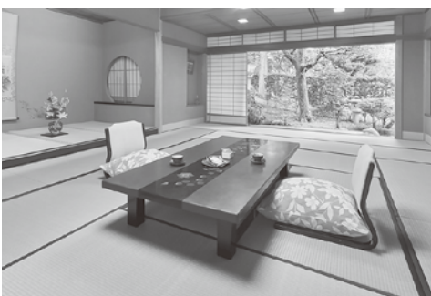
客室：ジャパニーズスイート

美肌にも効果が期待できる。食事は、新鮮なものをより安く提供できるようにと、毎日、小松の市場から仕入れを行っている。旅館の一押しは800g以上のこだわりの活ガニ。冬の時期限定なので、時期が合えばぜひご賞味いただきたい。旅館を訪れる客の5〜6割が小松市の方であるというのだから、地元の方から深く愛されてきた旅館であることがうかがえる。一方で、最近では県外からのヘルスツーリズムを目的とした滞在やスポーツ合宿のような利用も増えてきているという。「県内の客だけではなく、県外からの観光客を集客し、小松市の観光業を盛り上げていく末席としての責務もある。」と支配人は話す。