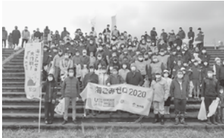
大川町会館前集合写真

ごみ拾いで各所から集めたごみの量は、ネットラック12台分になり、小松能美建設業協会の協力のもとエコジーパークこまつへ搬送した。尚、次回梯川ごみ拾いは、9月11日(土)に開催予定。