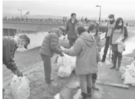
梯川沿川9カ所での一斉ごみ拾い