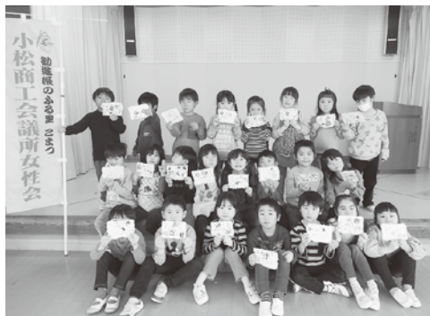
あたか認定こども園の皆「ケナフで紙すきましたよ!」

紙すき道具の貸し出しやケナフの種をご希望の方は、お問合せ下さい。(☎21・3121)