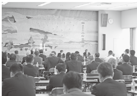
通常議員総会・評議員会の様子

度改正による専門家等派遣事業、生産性の向上や働き方改革への推進事業、地域資源を活用した観光振興事業等、新規事業を含む72の事業の実施を決めた。その他、北陸新幹線県内全線開業効果を高めるための事業や、小松空港の国際化推進、また国道360号(飛騨地域)小松空港間の整備に向けた活動なども実施。 これらの事業を通じて、新型コロナウイルスで疲弊した地元経済の回復を図り、更に当地域の将来への可能性を高め、交流人口の拡大に寄与しながら、活力溢れる地域経済を目指すこととした。