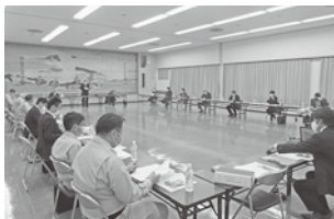
協議する実行委員会メンバー

今後は、本年5月に第31回遊泉寺銅山跡記念式典及び遊泉寺銅山跡整備事業(遊泉寺銅山ものがたりパーク)完成式、さくらの広場記念植樹式を開催し、遊泉寺銅山跡の本整備計画は一通り完了となる。