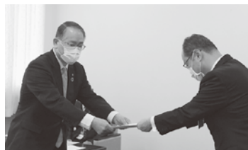
要望書を受け取る西会頭