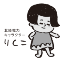
北陸電力 キャラクター りここ