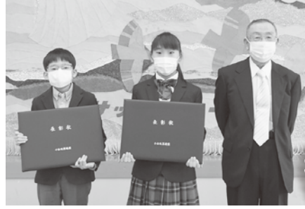
お世話になった先生と記念撮影

本表彰は、連盟に加盟する珠算塾において、1年以上の皆勤者や日商珠算能力検定1級合格者などの他の生徒の模範となる生徒に日本珠算連盟から表彰されるもので、本年度は26名が表彰を受けた。