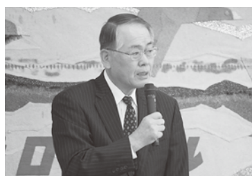
議長を務める西会頭

報告事項では、小松市長及び小松公共職業安定所から提出のあった「雇用確保及び労働環境の改善」についての要望書及び、新型コロナウイルス感染症石川県事業者向け補助金(当所受付分)の結果について報告し、閉会となった。