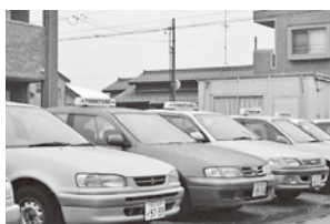
(石川県公安委員認定 第90号)

法人会員の方には代行料金割引、ご予約による昼代行など特典をご用意しております。詳しくは当社までお電話下さい。