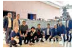
大和ミュージアムにて集合写真

そのほか、委員らは、広島平和記念資料館や世界遺産・日本三景である宮島・厳島神社などを見学した。