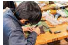
靴用の革を使ったカードケース作り