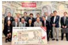
国立印刷局にて記念撮影