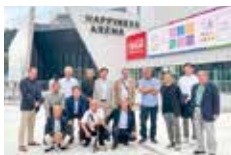
ハピネスアリーナにて集合写真

サッカースタジアム上空を滑走するジップラインも実施しており、試合のある日もない日も、いつ来ても楽しめる空間づくりによる集客策など、スポーツを核としたまちづくりの参考となる有意義な視察となった。