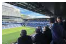
ピーススタジアムを視察