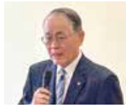
挨拶をする西会頭