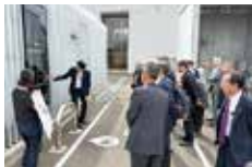
再エネ水素ステーションの説明を受ける委員

参加した委員は、高騰化する原材料、エネルギー問題への対策としての水素エネルギーに強い関心を寄せ、再エネ由来水素ステーション敦賀では、多くの質問が飛び交った。