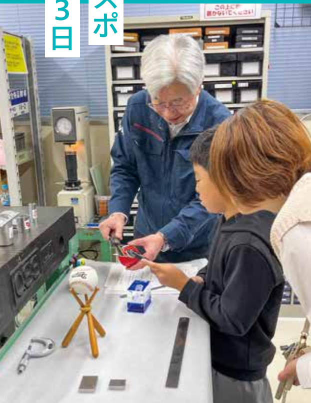
機械部品の検査体験