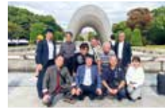
平和記念公園にて集合写真