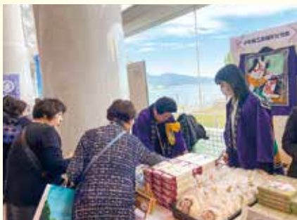
能登半島地震復興応援特別物産展の様子