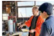
職人さんから直に説明

GEMBA モノヅクリ エキスポを見学・体験した参加者からは「自力で作った製品を大事に使いたい」「普段は見ることでできない夜の工場見学は迫力があり感動した」など多くの感想が寄せられた。